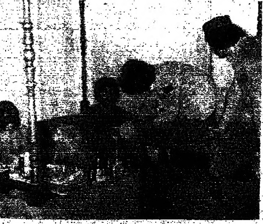
عملية انسحاب لحد الحصان